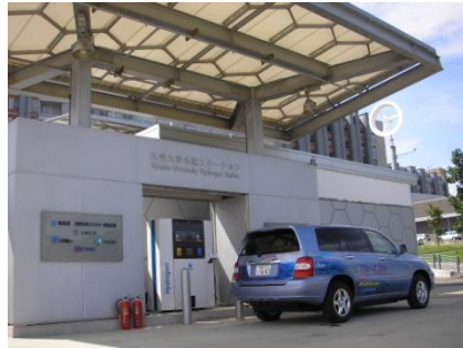
九州大学 水素ステーション

北九州市(東田地区), 福岡市(九州大学)の2カ所に水素ステーションを整備し、 北九州～福岡間に「水素ハイウェイ」を構築。(平成21年9月18日 始動)