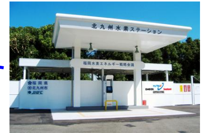
北九州水素ステーション