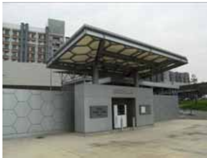
九州大学・水素ステーション

北九州市(東田地区), 福岡市(九州大学)の2カ所に水素ステーションを整備し、 北九州~福岡間(約80km)に「水素ハイウェイ」を構築。