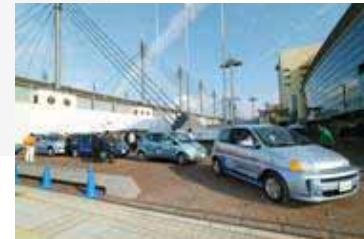
燃料電池自動車・水素エンジン車が自由に実証走行できる環境を提供