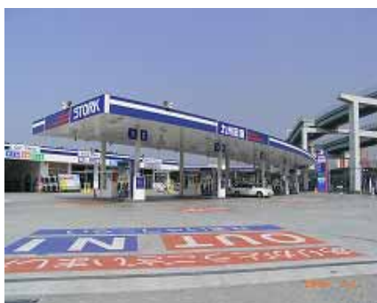
九石商事株式会社 エネルギーモール八幡東田 S S

南條 敦 ( なんじょう あつし ) グループマネージャー TEL : 0 3 - 3 5 0 2 - 9 2 5 7