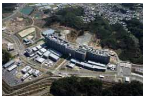
九州大学伊都キャンパス