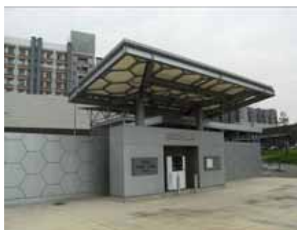
九州大学水素ステーション (現在は休止中)